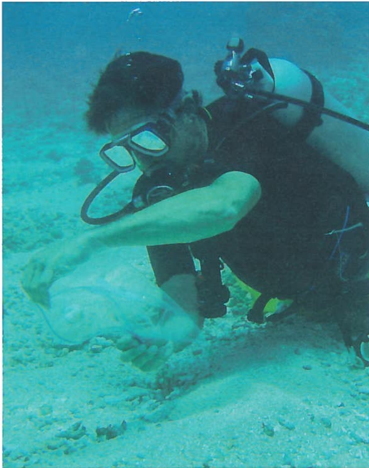
Auf Tauchgang: Ein Wissenschaftler der Smithsonian Institution ließ sich in Französisch-Polynesien den Spaß nicht nehmen, für die Probennahme in voller Montur abzutauchen.

„Natürlich war die Probennahme am OSD für die Forscher aufwendig: Sie brauchten Filterausrüstung und